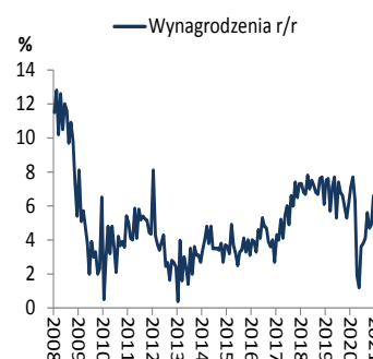
Wykres 2. Przeciętne wynagrodzenie (dynamika r/r)