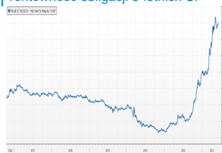
Wykres 3. Długoletni trend – rentowność obligacji 5-letnich SP