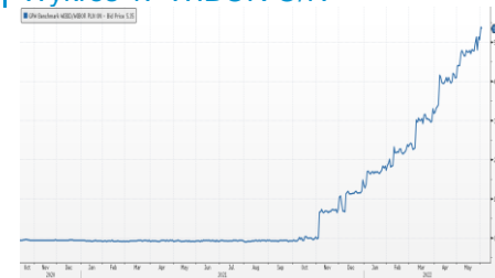
Wykres 1. WIBOR O/N

Dzisiaj publikowany jest raport o zatrudnieniu z USA za maj oraz indeksy PMI w usługach i łączne indeksy PMI za maj ze strefy euro.