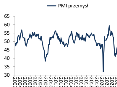
Wykres 3. PMI przemysł