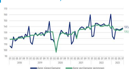
Wykres 3. Sprzedaż detaliczna (śr. mies. 2015=100)