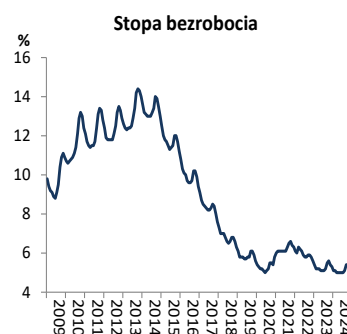
Wykres 1. Stopa bezrobocia rejestrowanego

W marcu wskaźnik PMI w przemyśle marginalnie wzrósł do 48,0 pkt. z 47,9 pkt. w lutym a sub-indeks nowych zamówień wzrósł do 45,9 pkt. w marcu z 45,8 pkt. w lutym.